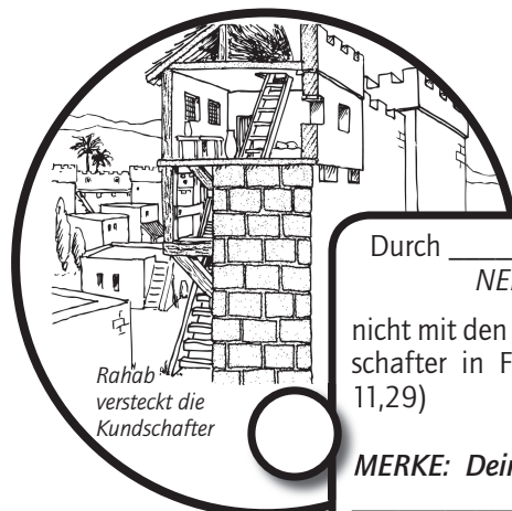
Rahab versteckt die Kundschafter

Durch _____ kam Rahab, die Hure, NEBUALG nicht mit den Ungehorsamen um, da sie die Kund- schafter in Frieden aufgenommen hatte. (Hebr 11,29)