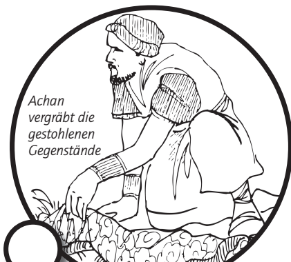
Achan vergräbt die gestohlenen Gegenstände

Das Volk Israel sollte 6 Tage jeweils _____ und am 7. Tag _____ LAMNIE LAMNEBEIS um Jericho marschieren.