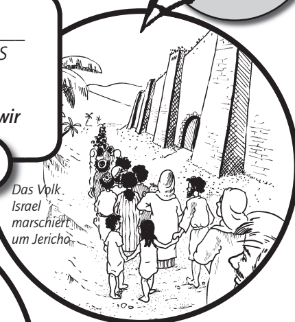
Das Volk Israel marschiert um Jericho

MERKE: Durch _____ haben wir Sieg. MASROHEG