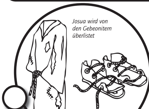
Josua wird von den Gibeonitern überlistet

Die Gedenksteine sollten die Nachkommen daran erinnern, dass Israel auf