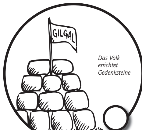
Das Volk errichtet Gedenksteine